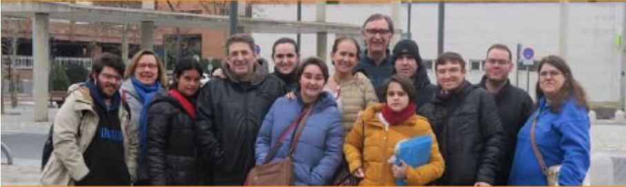
La historia de Verónica

La historia de Verónica cuenta la vida de una chica. A esta chica le pasan las mismas cosas que a los autores de esta novela. También tiene los mismos deseos que ellos. Los autores de esta novela son las personas del Programa Así Mejor del Ayuntamiento de Tres Cantos.